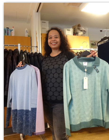
Besøg af tøjbussen