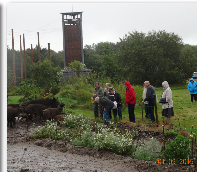
Tur til Klosterheden