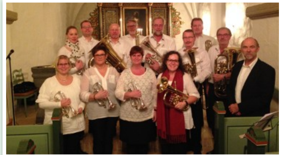
Lemvig Amatør Orkester