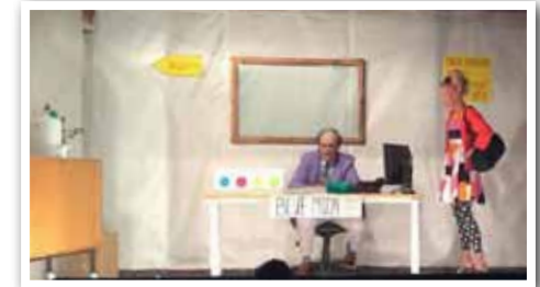
Fra årets Dilettant stykke "BLUE MOON"