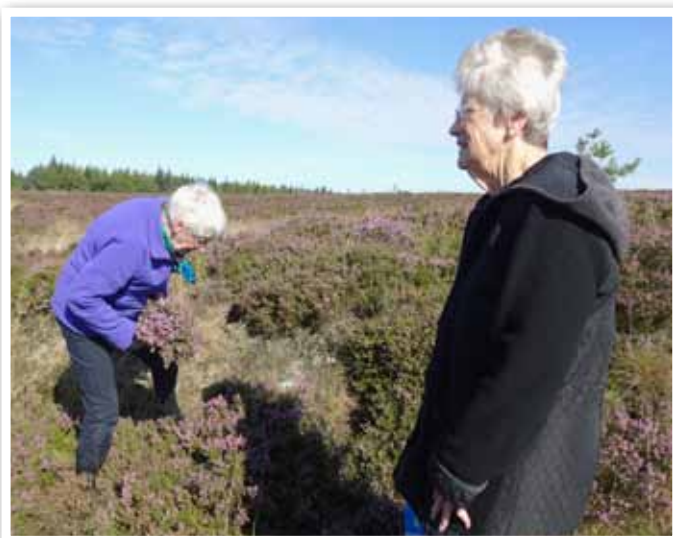
Billedet er fra en tur til de lyngklædte bakker i Klosterheden.

Tilmelding senest den 2. december til Gerda Lauritsen.