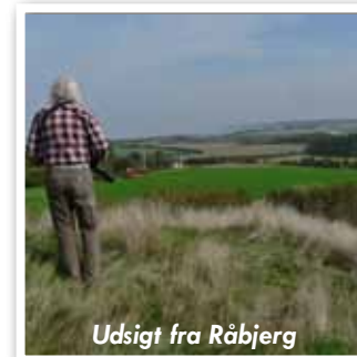
Udsigt fra Råbjerg