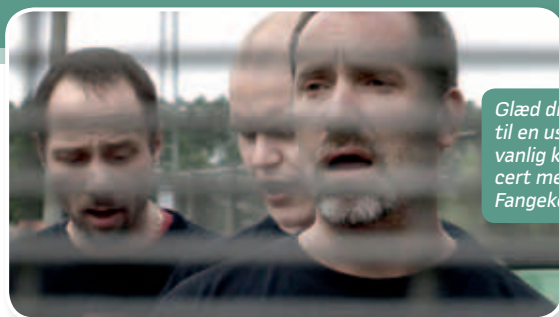
Glæd dig til en usædvanlig koncert med Fangekoret