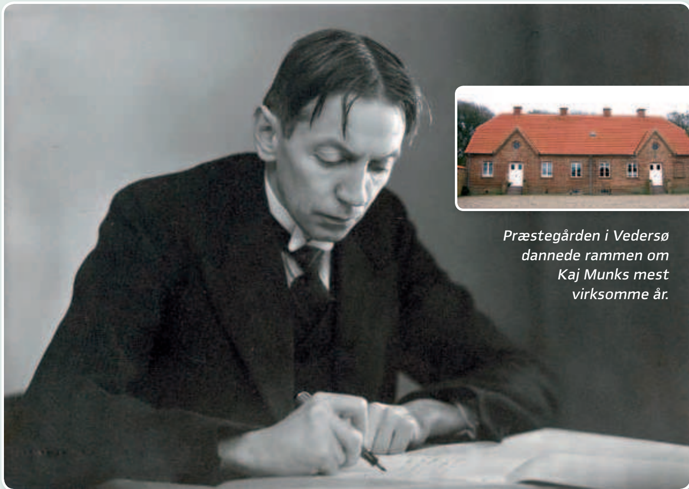
Præstegården i Vedersø dannede rammen om Kaj Munks mest virksomme år.

lig-sangen og O du Guds Lam , som synges ved altergang, ligesom Fadervor og trosbekendelsen står aftrykt på de steder i gudstjenesten, hvor de lyder. Det er også anført, hvornår menigheden skal rejse sig op.