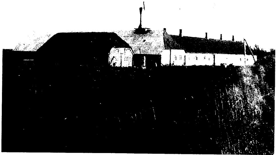
Fattiggården i Gudum. Årstallet er ukendt.

Den 19. oktober 1868 indkaldtes til møde på Remmer Kro. Man ville under-